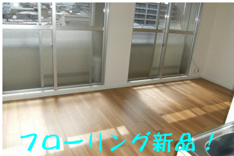
フローリング新品!